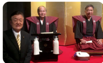
▲ 桜川市・真壁「人形浄瑠璃真壁白井座」の公演を観劇。地元内外の支援も得てこれからも継続してほしいと思います。