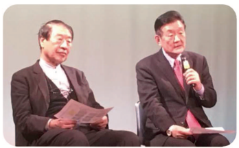
▲ワールドフォーラム「いのちと種を守る」で山田正彦元農水大臣と、種子法改正の脅威について講演。