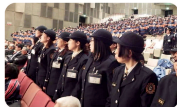
▲ 取手市消防出初式に出席。女性団員も多く、操法大会も強い消防団です。