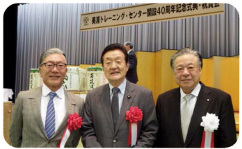
▲JRA美浦トレーニングセンター開設40周年記念式典に出席。今後も数々の名馬の誕生を期待します。