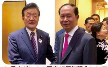
▲日本ベトナム国交45周年記念レセプションに出席。天皇陛下ご夫妻、クワン国家主席ご夫妻が出席されました。