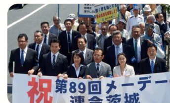
▲ 連合茨城主催「第89回茨城県中央メーデー」に参加。水戸郵便局から水戸京成百貨店まで行進しました。