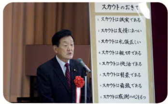
▲日本ボート外茨城県連盟総会でボートが振興議連の一員として挨拶。昨年は高萩ジャンボレットが大成功!