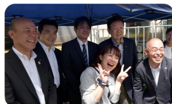
▲ 日立AP多賀工場「ファミリー大集合」浅野哲衆議院議員、齋藤英彰県議、二川英俊県議、関根健治委員長と。