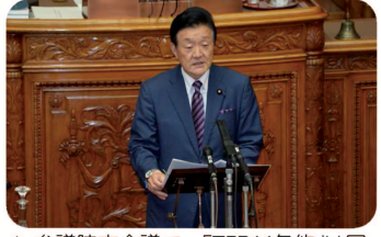
▲参議院本会議で、「TPP11条約」は国民生活と農業に大打撃を与える問題である、と代表質問しました。