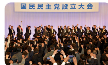
▲ 国民民主党結党大会に出席。詳細は1面と4面をご覧ください。