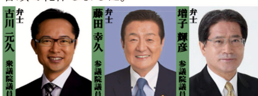
古川元久 衆議院議員