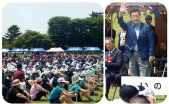
▲茨城県ゆうあいスポーツ大会の開会式に出席。障害を持った方々が行う9つの競技大会です。