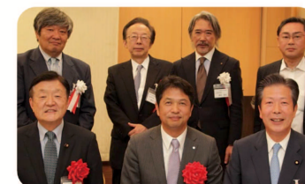
▲ 茨城大附属中同窓会有志による大井川知事就任祝賀会に出席。右下は山口那津男公明党代表。