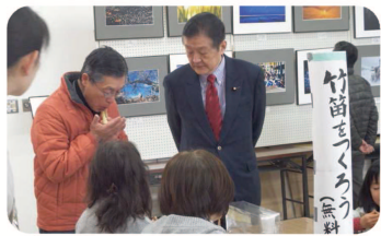
▲地元の寿地区ふれあいの集いに参加。地域の方々や子供たちと竹笛作りに挑戦しました。