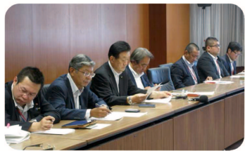
▲交運労協議員懇談会として運輸労連・サービス連合・海員組合・全港湾幹部と国交省に要望活動。