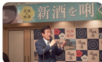
▲ 茨城県酒造組合主催「新酒をさく会」に参加。若い杜氏や女性の杜氏が活躍。茨城のお酒は輸出も好調です。