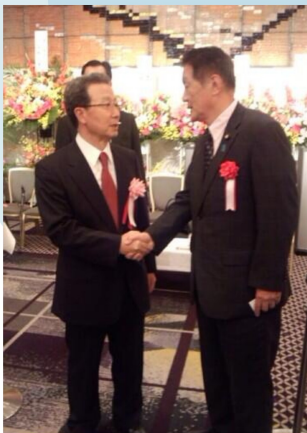
中国建国64周年レセプションで程永華大使と