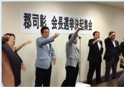
代表世話人として郡司彰参議院会長候補を応援