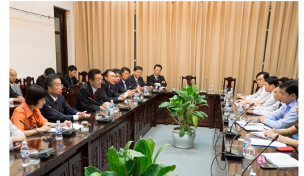
タン交通運輸大臣（右端）と会談