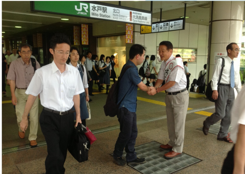
参議院当選の翌日、水戸駅で当選報告