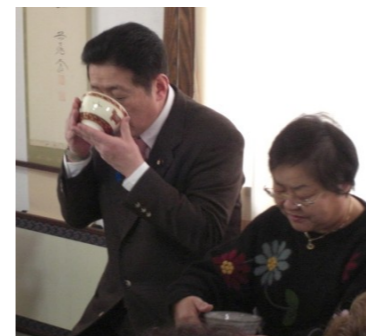
▲寿ふれあいのつどい 3/14