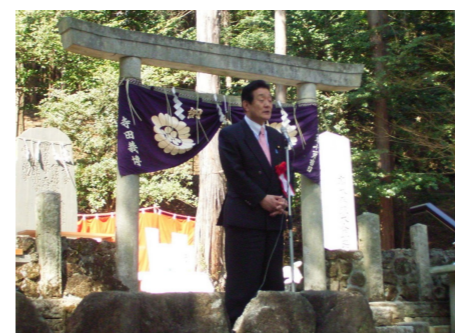
▲六所皇大神宮「春の六所大祭」 4/10