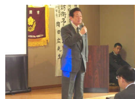
▲第47回交通・防衛講演会 4/12