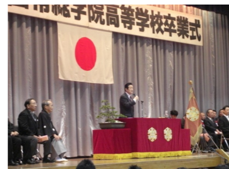
▲常総学院高等学校の卒業式 3/1