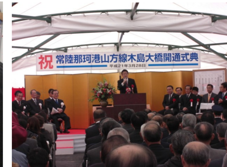
▲主要地方道常陸那珂港山方線木島大橋開通式典 3/28