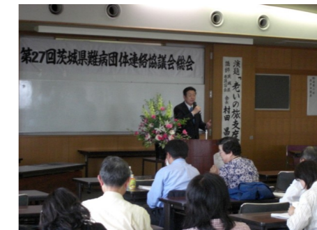
▲茨城県難病団体連絡協議会 5/10