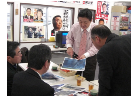
▲消防研究会にて講演 3/14