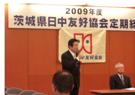
▲茨城県日中友好協会2009年度定期総会 4/24