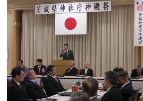
▲茨城県神社庁神殿祭 5/9