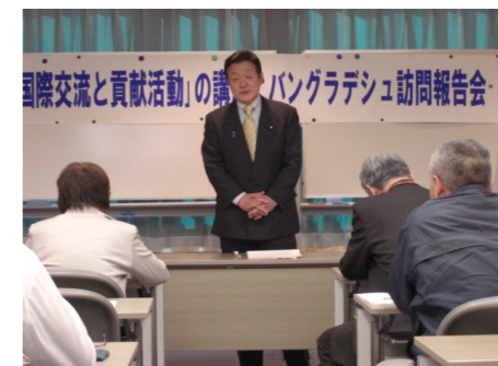
▲茨城 Bangladesh 友好協会で講演 3/15