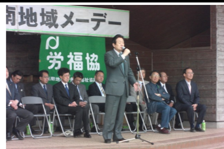
▲県南地域メーデー 4/26