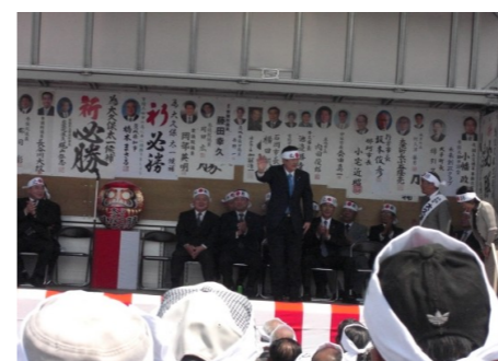
▲常陸太田市市長候補大久保太一の出陣式 5/10