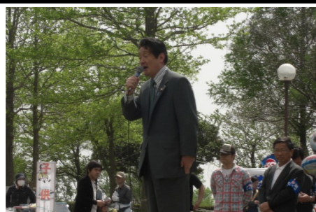
▲土浦地域メーデー 4/26