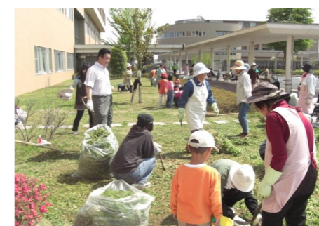
▲地域のボランティア活動 4/29