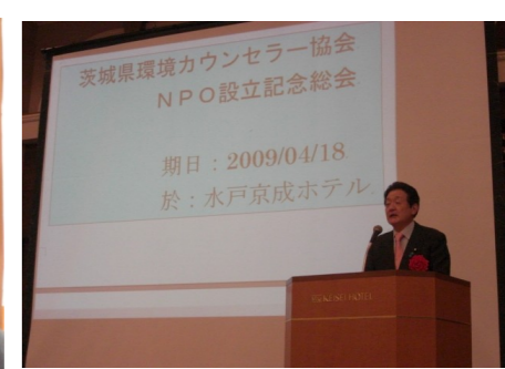
▲茨城県環境カウンセラー協会設立講演会 4/18