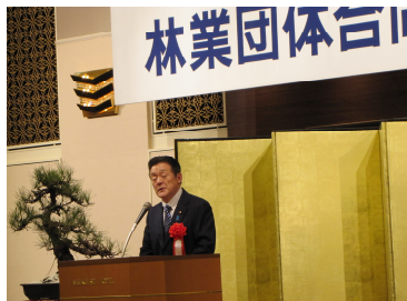
林業団体合同新年の集い（1/25）