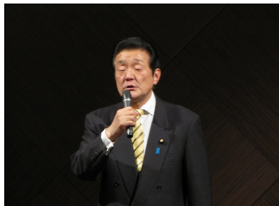
水戸市歯科医師会（1/8）