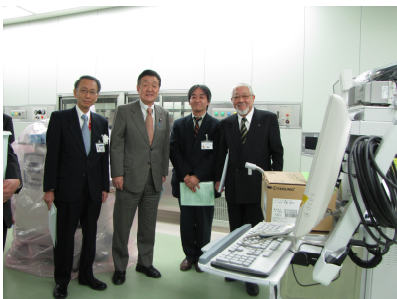
県立中央病院救急センター・循環器センター竣工式典（1/29）