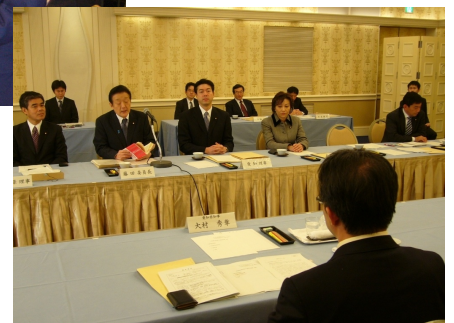
河村市長に本を贈呈