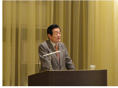
宅建協会県北支部で講演（1/20）