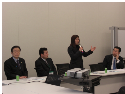
金メダリストの吉田沙保里選手らを招いて先端医療講演会を開催（2/23）