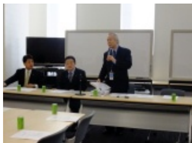
平和構築議連で軍事アナリスト小川和久さんが講演（2/15）