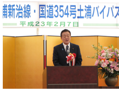
国道354号土浦バイパス開通式（2/7）