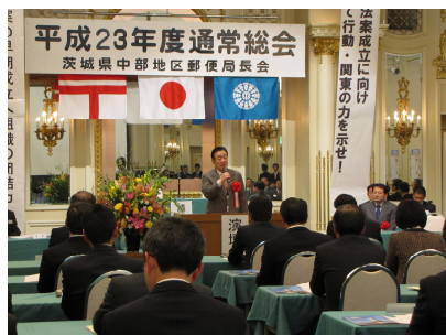
茨城県中部地区郵便局長会（1/29）