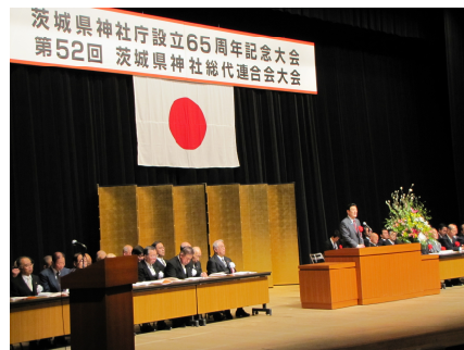
茨城県神社総連合会大会（3/2）