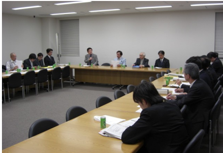
▲テロ被害者・家族支援研究会 各省庁ヒアリング 5/20