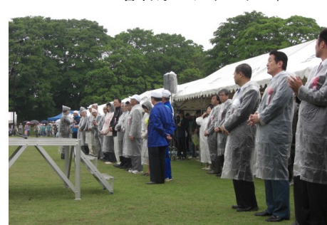
▲茨城県障害者スポーツ・文化協会 第11回茨城県ゆうあいスポーツ大会 5/24