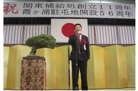
▲自衛隊関東補給処創立11周年 霞ヶ浦駐屯地開設56周年記念式典 5/17