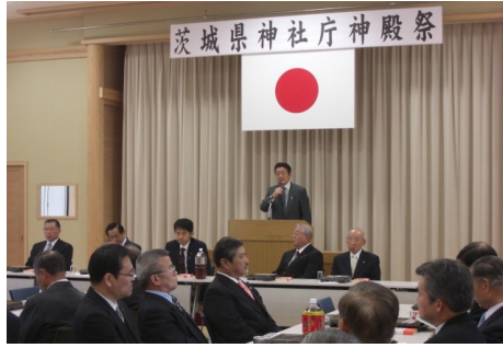
▲茨城県神社庁神殿祭 5/9