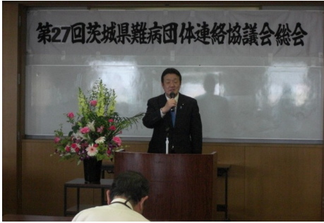
▲茨城県難病団体連絡協議会総会 5/10