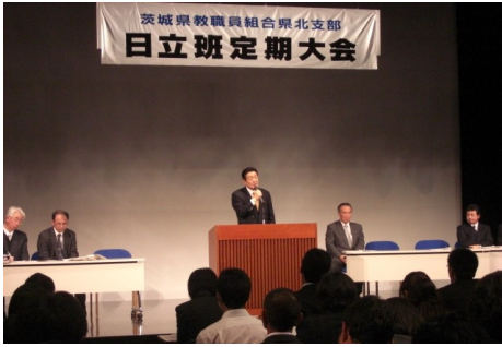
▲茨城県教職員組合県北支部 日立班定期大会 5/8