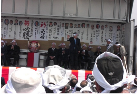
▲常陸太田市長候補大久保太一出陣式 5/10