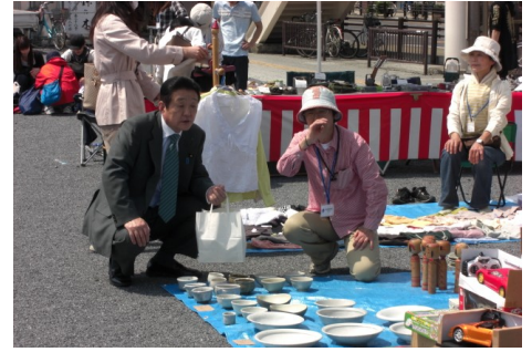
▲黄門さん青空マーケット 5/9