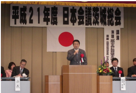
▲日本会議茨城総会 5/23