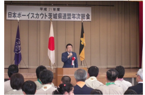
▲日本ボーイスカウト茨城県連盟年次総会 5/24