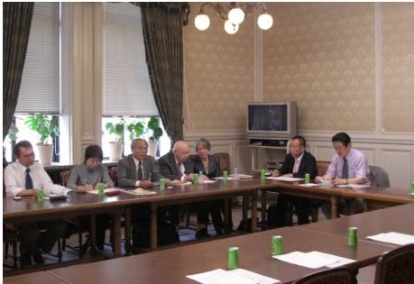
▲戦後処理PT捕虜問題小委員会 5/20