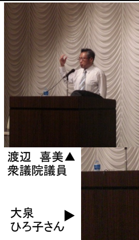
▲渡辺 喜美 衆議院議員