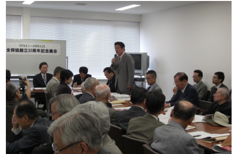
▲全国抑留者補償協議会30周年記念集会 5/22