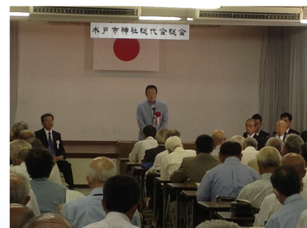
水戸市神社総代会総会で挨拶（8/30）