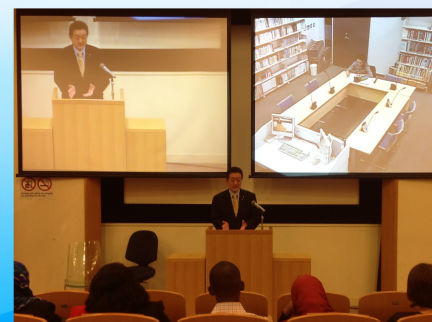
常磐大学国際被害者学研究所の公開講義で講演（10/4）