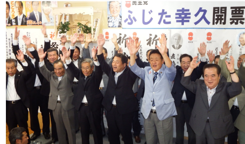
橋本知事、各首長、医師会他支援者の皆さんと万歳三唱（7/21）