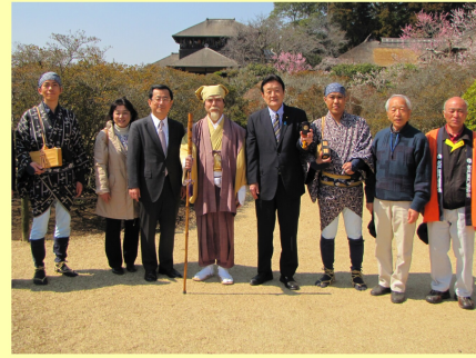
借楽園での観梅ウォーク (3/16)