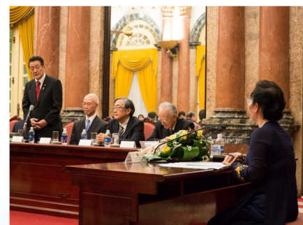
日本ベトナム国交樹立40周年記念式典で副主席に挨拶（9/21）