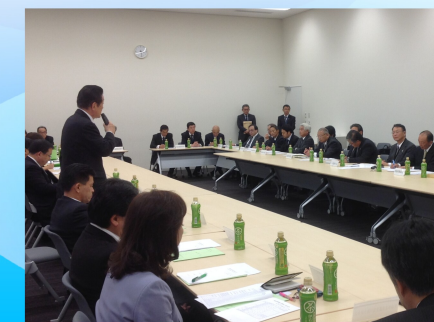
茨城県農林水産関係団体連絡会による要望を聞く会で挨拶（11/14）