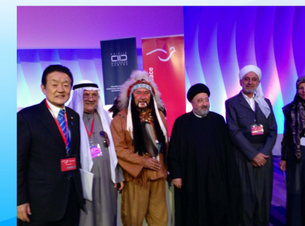
ウィーンで開催された世界宗教者平和会議に出席（11/19）