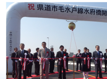
県道市毛水戸線水府橋開通式でテープカット（10/31）