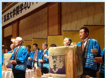
筑波大学開学40+110周年記念式典に出席（10/1）