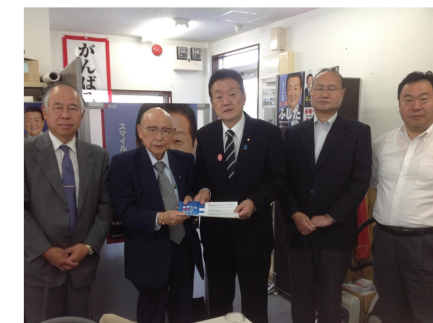
日本税理士政治連盟から税理士法改正についての要望（10/16）