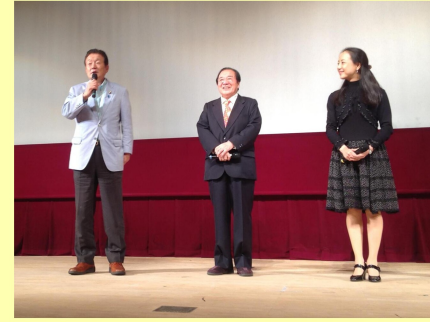
映画「杵掛時次郎」の先行上演会で愛川欣也監督と挨拶 (9/15)

「藤田幸久メールマガジン」 好評配信中！ お申し込みは下記フォームから お願いします。