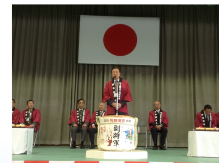
勝田駐屯地・施設学校開設62周年記念祝賀会に出席（11/2）