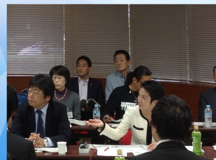
那珂市事業仕分けに蓮舫議員と参加（10/5）