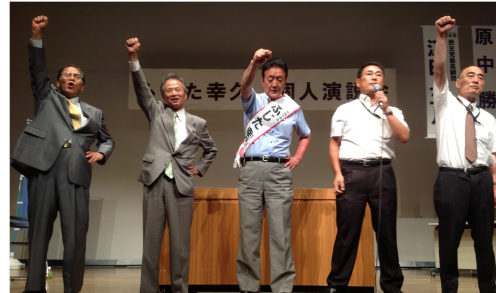
左から原中前日本医師会長、江田元参議院議長（7/9）