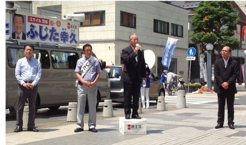
吉成日立市長、長妻元厚労大臣と（7/11）