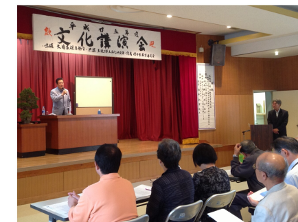
文化講演会（行方市）で挨拶（10/6）