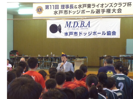
水戸東ライオンズクラブ主催ドッジボール選手権で挨拶（10/19）