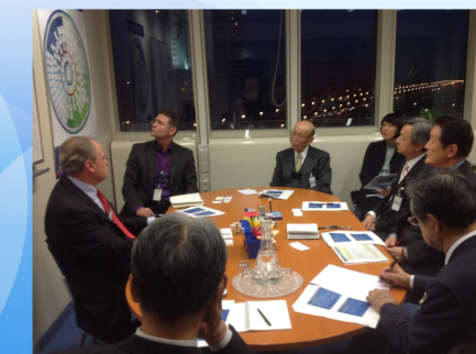
国際エネルギー機関（IAEA）で原発事故の対応を調査（11/22）