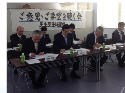
民主党茨城県連で各種団体からの要望を聴く（11/14）