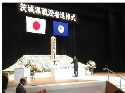
茨城県戦没者追悼式で追悼の辞（8/21）