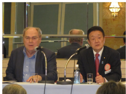
「日本権力構造の謎」の著者ウォルフレン氏の講演を通訳（1/24）