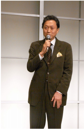
▲鳩山由紀夫幹事長