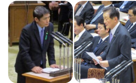
▲参議院東日本大震災復興特別委員会で、民間災害支援組織「ひのぎしん災救隊」への政府の支援について質問しました。