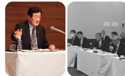
▲自治労茨城自治体議員学習会で「政権交代「ミ」を日本でも」をテーマに講演。