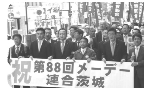
▲連合茨城の第88回メーデーで水戸市内を行進。