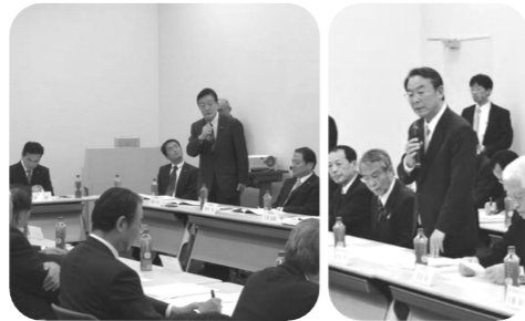
▲茨城県農林水産団体連絡会による要望を聴く会が国会内で開催。