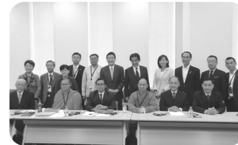
▲WCRP(世界宗教者平和会議)国際活動支援議員懇談会開催。ベトナム・ラオス・タイの宗教指導者代表団をお迎えしました。