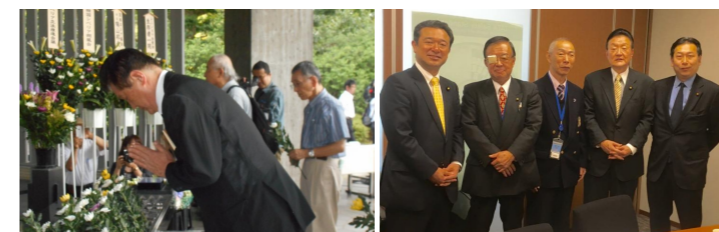
千島ヶ淵シベリア抑留者追悼の集い