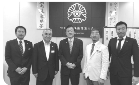
▲つくば中央倫理法人会で、「落選時代に私を支えた倫理法人会」をテーマに講話。