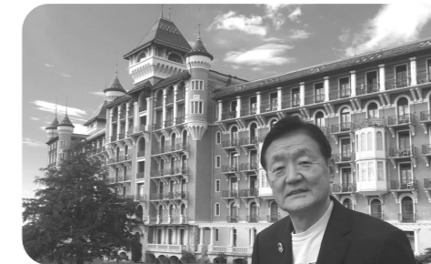
▲スイスの国際IC(MRA)会議に出席。戦後の独仏の和解や日本の国際社会復帰の橋渡し役を果たした場所です。