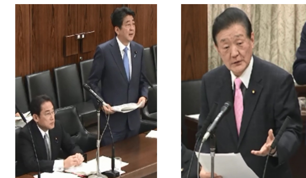
安倍首相と岸田防衛大臣に質問