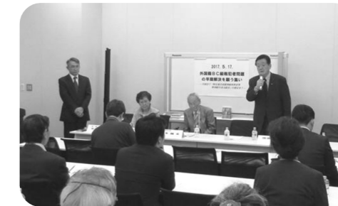
▲外国籍BC級戦犯問題の早期立法解決を願う集いに参加。元BC級戦犯に対する支援法案を超党派で実現しました。