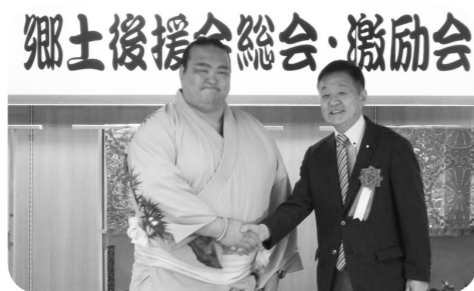
▲牛久市で開催された「横綱稀勢の里 郷土後援会総会・激励会」に出席。