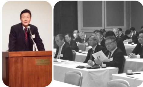
▲水戸商工会議所金融・経営支援部会で講演。