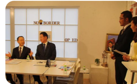
▲ネット番組「ニュース・オピエド」に3回出演。訪米、訪欧報告や10月の衆院解散総選挙などについて報告しました。