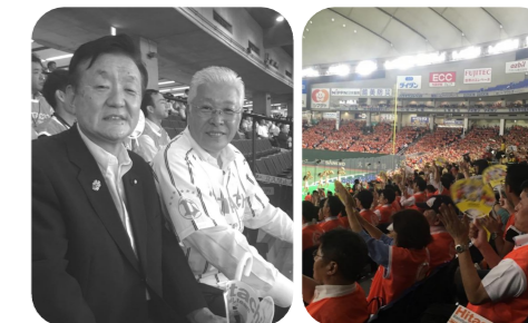
▲都市対抗野球、日立製作所の試合を小川春樹日立市長と応援。