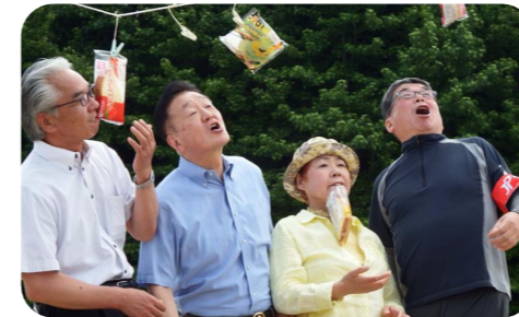
▲JP労組水戸支部の運動会でパン食い競争に参加。パンを取るまでに時間がかかりました。