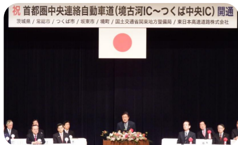
▲圏央道茨城県内全面開通式典に出席。