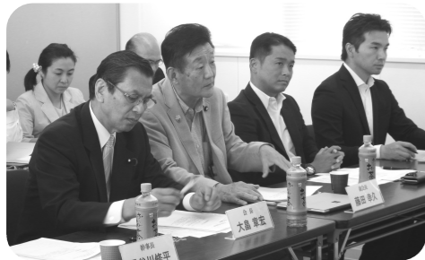
▲民進党茨城県連主催「ご意見・ご要望を聴く会」を開催。