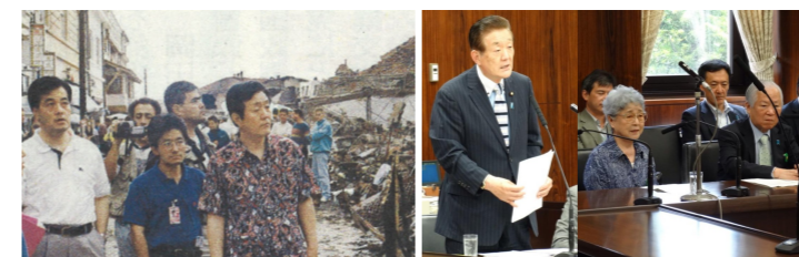
コンボ難民を援助

口紙」や米国「NBCテレビ」の記者達は安倍首相の軍国主義的姿勢に懸念を示していました。米国のシンクタンクが「軍事衝突が起きれば日本と韓国民の210万人が死亡する」との予測をまとめました。米軍司令官の一人は、「トランプ大統領が『違法』核攻撃を命じた場合には拒否する」と述べました。戦争をさせない外交を日本が主導すべきです。