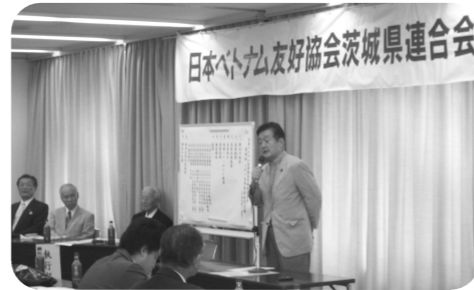
▲設立50周年を迎えた日本ベトナム友好協会茨城県連合会の総会に出席。