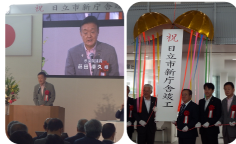
▲日立市役所新庁舎竣工式に出席。東日本大震災で本館機能が不能になり、財務副大臣として予算を増額しました。