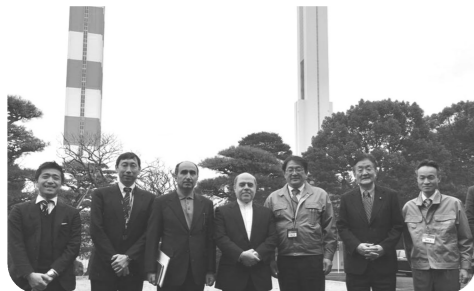
▲レザ・ナザルアハリ駐日イラン大使のお供で、日立製作所水戸工場を視察。