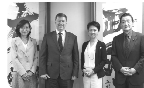
▲ポール・マデン駐日英国大使による連舫代表への表敬訪問に同席。