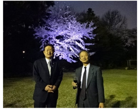
江田五月議員と英国大使館のお花見会に出席しました。