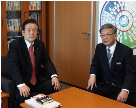
沖縄県の翁長知事が、3月27日に参議院本会議で可決された西普天間住宅の返還に伴う跡地利用の法案のお礼に来訪。