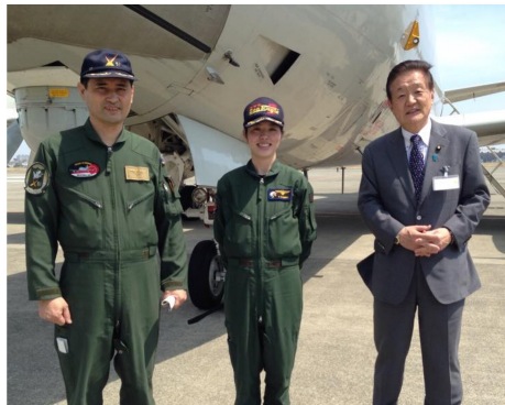
参議院外交防衛委員会で海上自衛隊厚木基地の固定翼哨戒機P-1の視察を行いました。