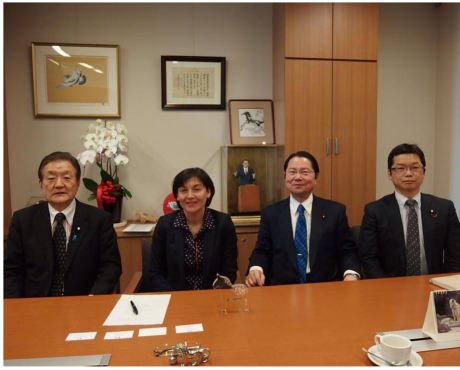
フランスのジラルダン国際開発・エネルギー大臣を国際連帯税議連の幹部がお迎え。政治的なイニシアチブが必要です。