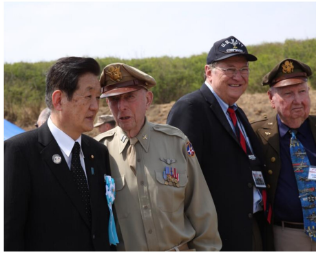
日米硫黄島戦没者合同慰霊追悼顕彰式に参加しました。捕虜の方も含め元兵士との交流で、平和の大切さを感じます。