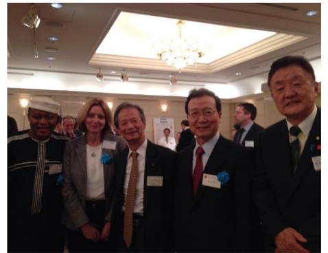
民主党国際局の企画によるインターナショナル・レセプションが開かれ、85ヶ国と地域から約185名の外交官が出席。