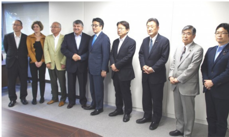
アメリカ労働総同盟産別会議（AFL-CIO）のリチャード・トラムカ会長、キャシー・ファインゴールド国際局長らを党本部に迎え、日本の政治情勢、国会情勢、民主党の基本姿勢等について説明し意見交換。