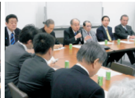
▲平和構築推進議員連盟で 明石康元国連事務次長を迎える 3/11