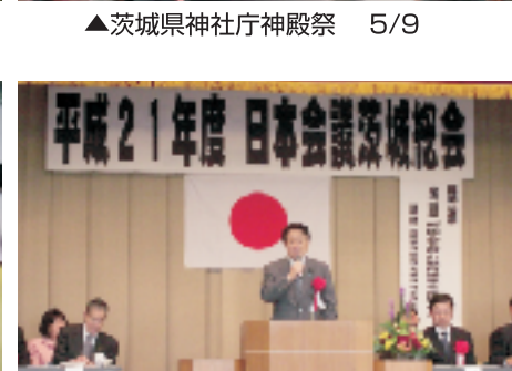
▲日本会議茨城総会 5/23