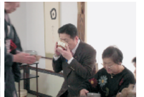
▲寿ふれあいのつどい 3/14