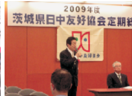
▲茨城県日中友好協会 2009年度定期総会 4/24