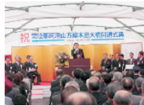
▲主要地方道常陸那珂港 山方線木島大橋開通式典 3/28