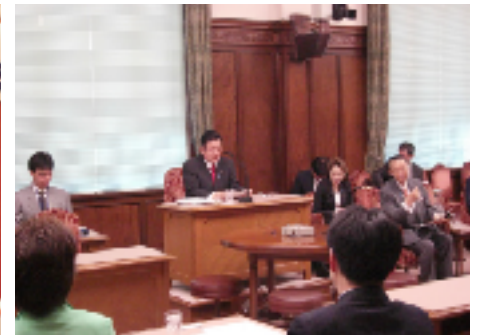
▲拉致特別委員会の委員長として 4/27