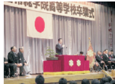
▲常総学院高等学校の卒業式 3/1

6月14日、読売 テレビ系列で放映 された「たかじん のそこまで言って 委員会」に出演し、 9.11テロ疑惑につ いて議論しました。