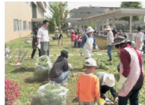
▲地域のボランティア活動 4/29