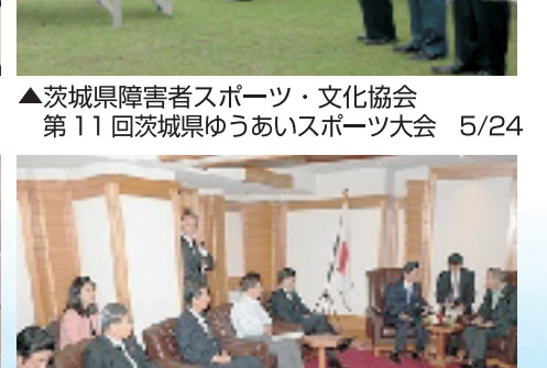
▲潘基文国連事務総長との会談 7/1