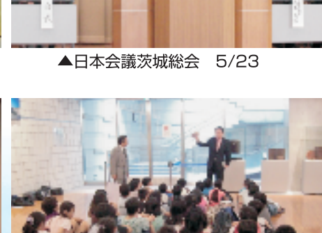
▲杉並第一小学校国会見学 6/25