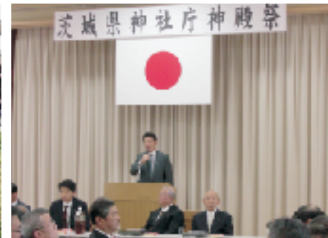
▲茨城県神社庁神殿祭 5/9