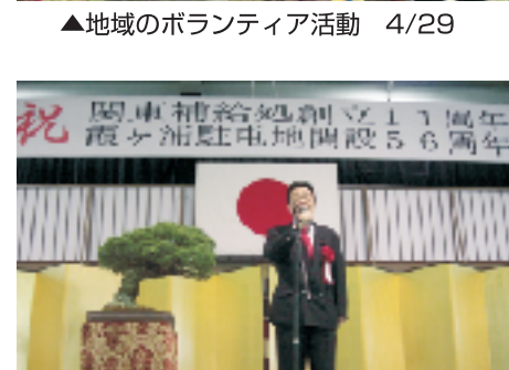
▲自衛隊関東補給処創立11周年 霞ヶ浦駐屯地開設56周年記念式典 5/17