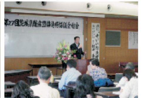
▲茨城県難病団体連絡協議会 5/10