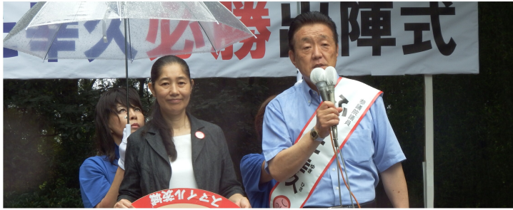
7/4 多くの方に見守られての出陣式