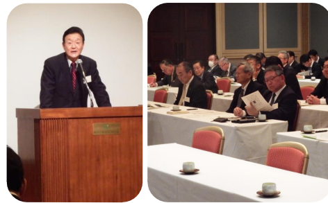
▲ 水戸商工会議所金融・経営支援部会で講演。戦後日本の国際社会復帰に活躍した政財界の先人の行動を紹介。