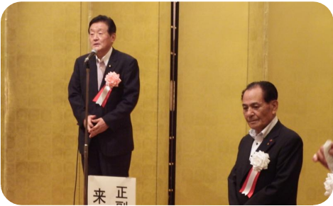
▲ 茨城県商工会連合会総会に出席。