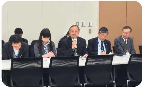
▲ 党國酒支援議連総会で日本酒造組合や政府からヒアリング。清酒の輸出も近年増大し、乾杯条例も増えています。