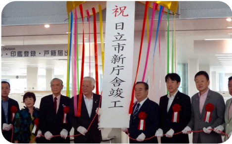
▲ 日立市役所新庁舎竣工式に出席。東日本大震災で本館機能が不能になり、財務副大臣として予算を増額しました。