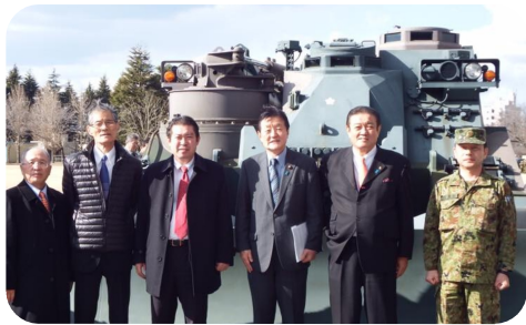
▲ 水戸市内のライオンズクラブで陸上自衛隊勝田駐屯地を視察。PKOの施設部隊の活躍に頭が下がります。