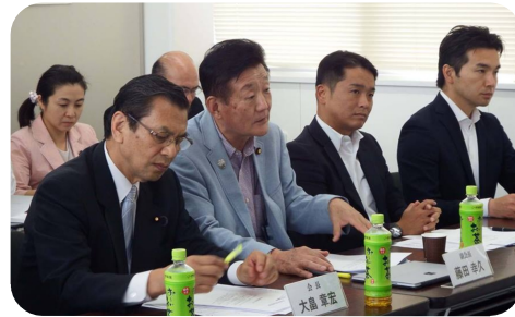
▲ 民進党茨城県連主催「ご意見・ご要望を聴く会」を開催。多くの団体から要望を受けました。