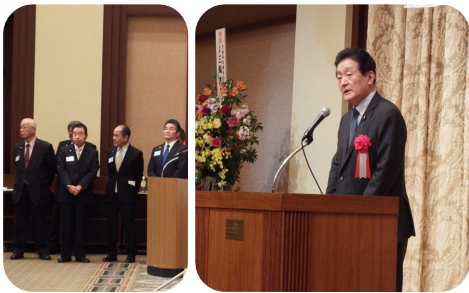
▲ 県土地建物取引業協会新春の集いに出席。県有地の売却・利用なども含め、茨城県に貢献しています。