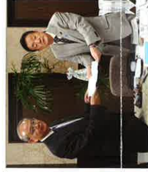
本間ひたちなか市長から