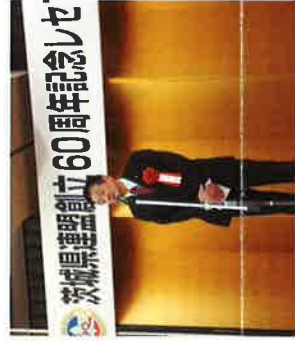
ポニーカウアウト茨城県連盟60周年