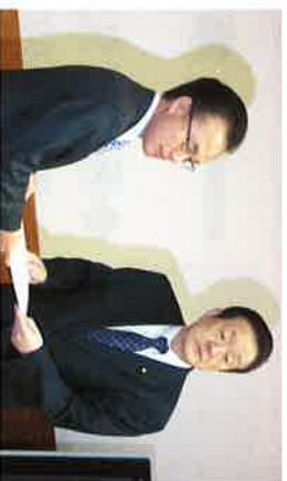
富岡朝霞市長に朝霞住宅建設中止を報告

国家公務員宿舍の大幅削減計画を発表 25%(3万7千戸)削減、山手線内は原則的に廃止、 幹部用宿舎は建設しない、家賃の値上げなどを大 胆に決定。