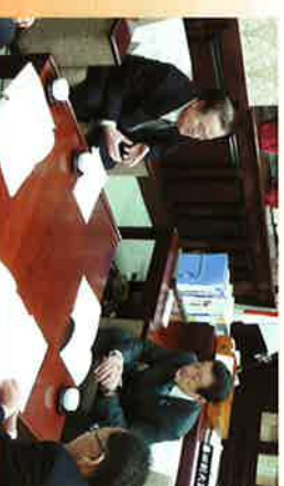
橋本昌茨城県知事から要望を受ける(財務副 大臣室で)