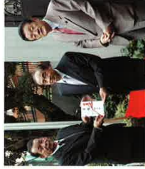
カンボジア大使館に日立の桜を贈呈。(中央が大使)