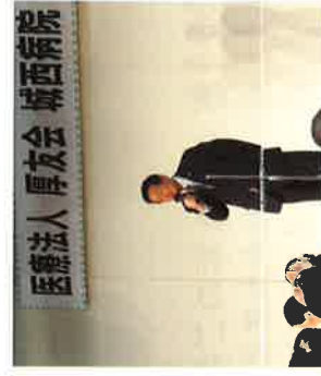
城西病院30周年記念祝賀会

望年会—日本の再生を目指して 12月14日、藤田幸久東京後援会の主催で300人程にご来場いただきました。 有難うございました。