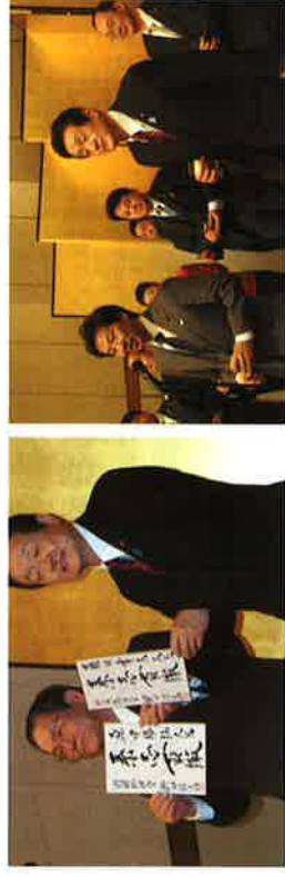
写真左/日本医師会原中会長(左)とともに野田総理大臣からの色紙を受け取る 写真右/40人の国会議員を代表して安住財務大臣(左)が乾杯の発声

望年会—日本の再生を目指して 12月14日、藤田幸久東京後援会の主催で300人程にご来場いただきました。 有難うございました。