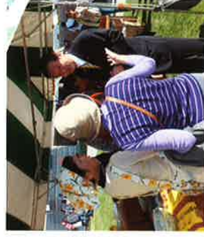
茨城のお茶応援イベント