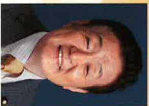
財務副大臣 参議院議員