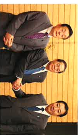
日本医師会原中会長と野田総理大臣に要望