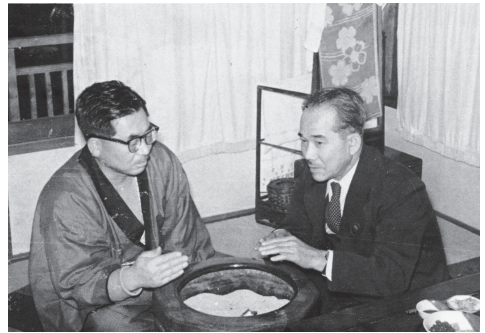
熱海温泉の火鉢で談笑する加藤勘十衆院議員（右）と山花秀雄衆院議員