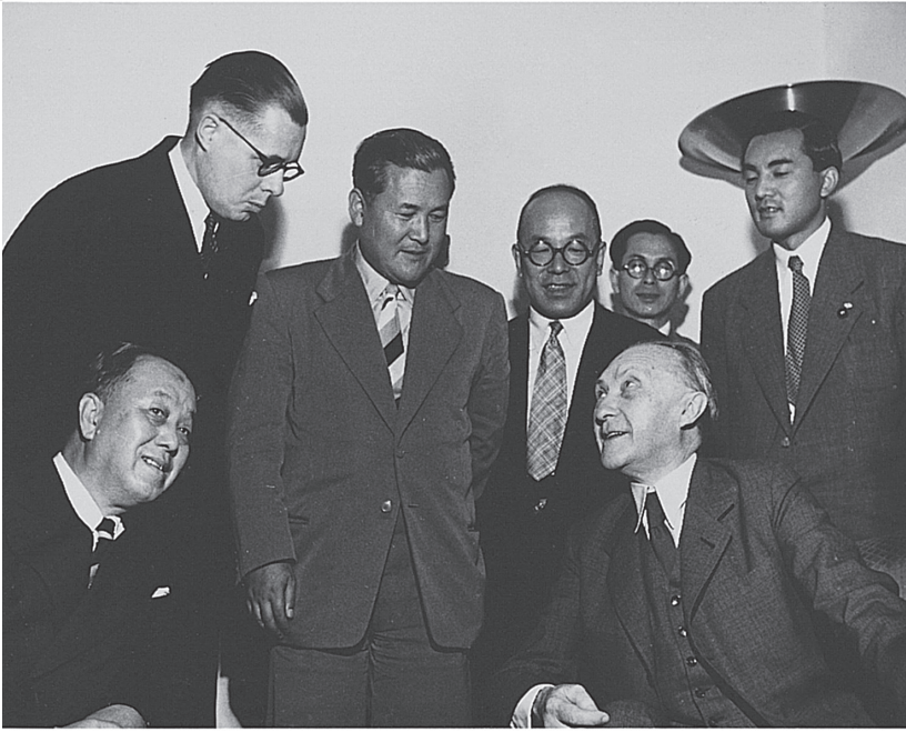
ヨーロッパ訪問の日本代表団一行を迎える西ドイツのコンラッド・アデナウアー首相（手前右）。（左から）北村徳太郎（国民民主党）、福田篤泰（自由党）、青木理三重県知事、中嶋勝治金属労組役員、中曽根康弘（国民民主党）（1950年）

浜井信三広島市長から、木の十字架をマンションハウスで受け取るフレデリック・ローランド、ロンドン市長。この木は市の創設を記念して植樹され原子爆弾によって爆破された樹齢400年の楠から彫られたものである（1950年）