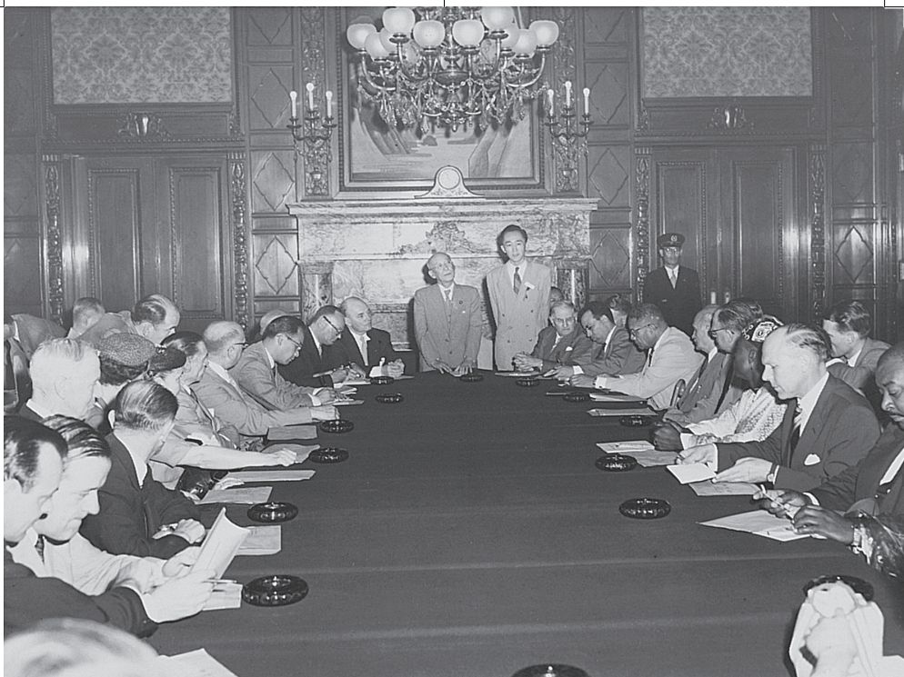
参議院内でMRA世界代表一行に歓迎挨拶する河井弥八参議院議長。議長をは さんで右がデンマークのオール・ジョン・クラフト前外相、左がスイスのオ スカー・ライムグラーバー元大統領 (1955年)