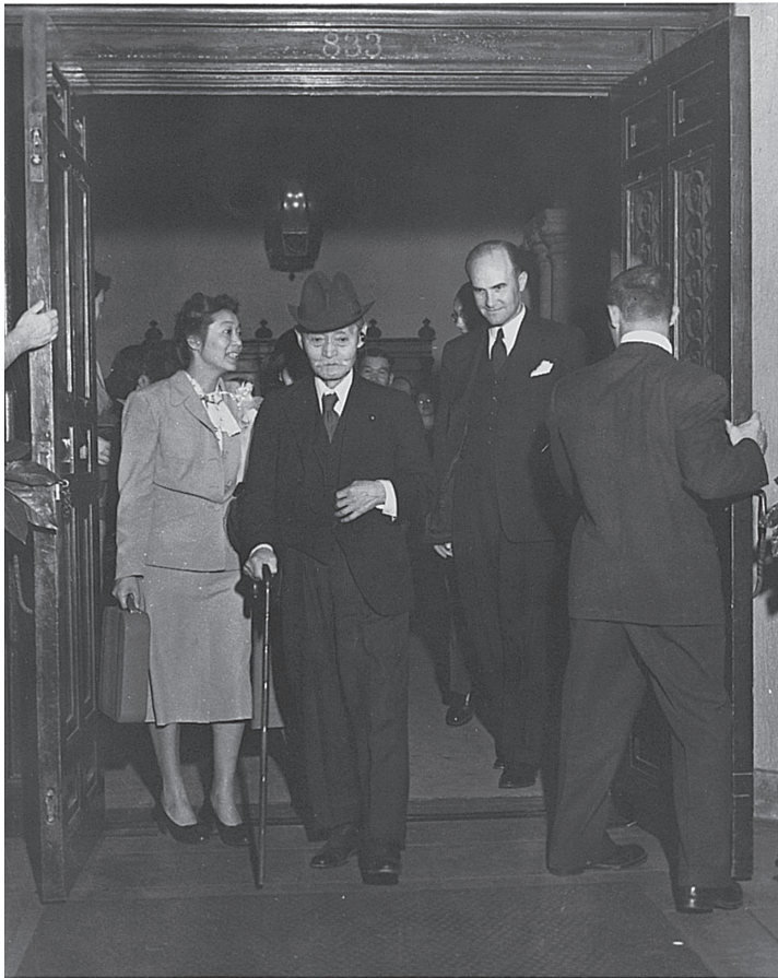
アメリカを訪問する“議会政治の父”尾崎行雄衆議院議員と三女相馬雪香（1950年）