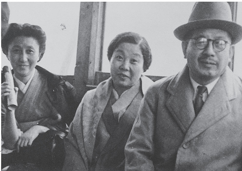
西ドイツのルール地方を旅する片山哲元首相夫妻。左端は三井英子夫人（1949年）

スイス、コーのMRA国際会議場で食事作りに励む日本代表。ここでは会議の進行、運営のほか、音楽や演劇、通訳、医務室、託児所、ベッド作り、皿洗いなどすべてを参加者が分担して行う。共同作業を通して立場や言葉の壁を超えた相互理解が深まる。後列の中央が中曽根康弘衆議院議員（1950年）