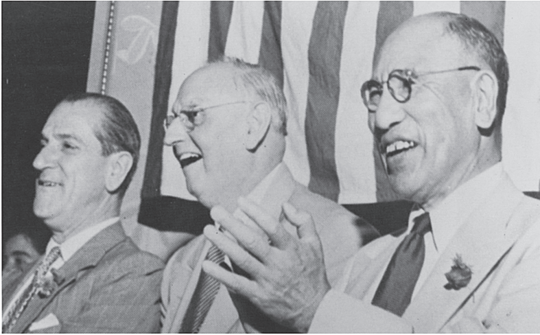
スイス、コーのMRA世界大会で壇上に並ぶ（左から）アントニオ・バンティ（イタリア電機工業会理事長）、フランク・ブクマン博士、石坂泰三東芝社長（1950年）