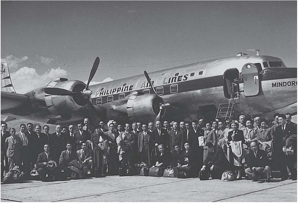
スイス、ジュネーブ空港に到着する戦後初めて海外渡航を許された日本の大型代表团（1950年）