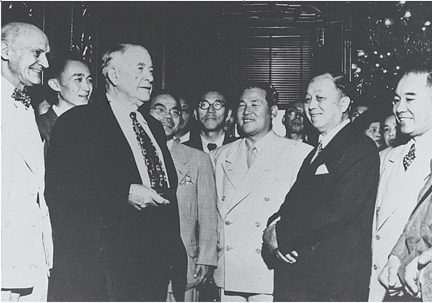
日本代表団をアメリカ議会で迎えるパークレー副大統領（左から2人目）とアレキサンダー・スミス上院議員（左端）。北村徳太郎議員（右から2人目）が下院で、栗山長次郎議員（右端）が上院でそれぞれ演説した（1950年）