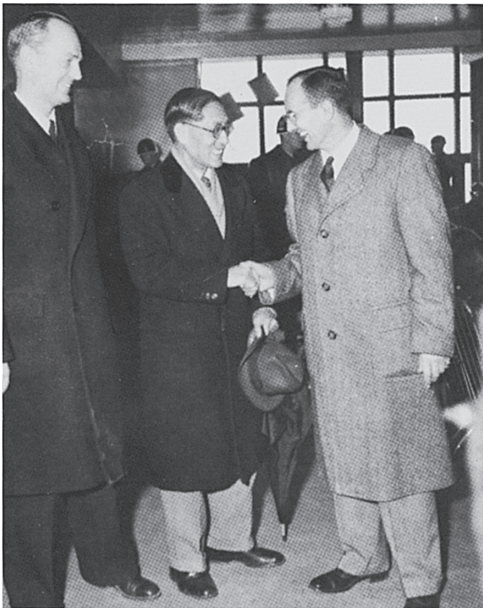
ケン・トウィッチェル（左）と著者（右）を東京で迎える堀内謙介元駐米大使（1950年）