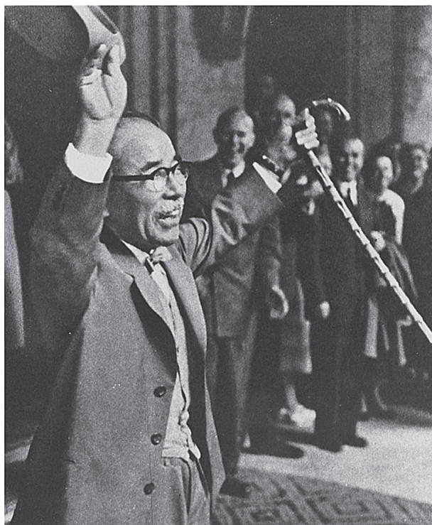
コーのMRA会議場を出発する国鉄十河信二総裁。世界で最も速い時速250kmの夢の超特急を開発した（1956年）