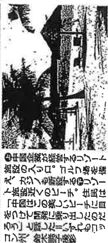
カンボジアが懸念するココン州。カンボジア政府による。