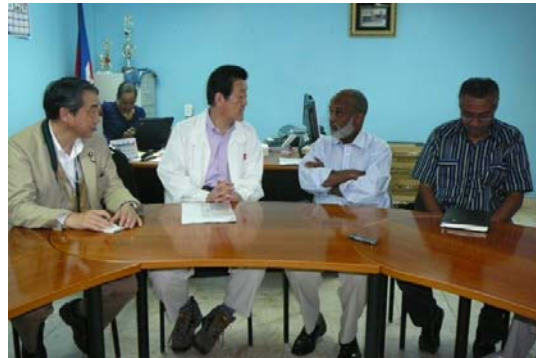
プレヴァル大統領