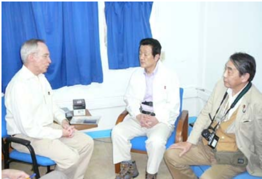
ミューレ国連代表