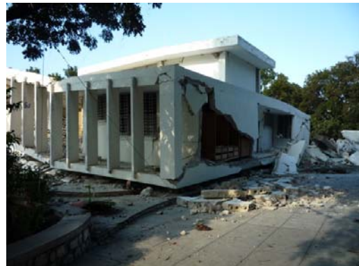
在ハイチ日本臨時代理大使公邸