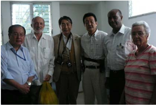
ハイチコミュニティー病院に義援金贈呈