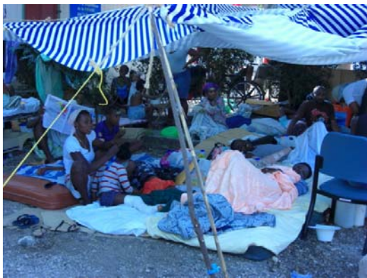
ハイチ国立大学病院前