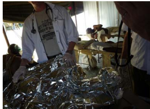
イスラエル軍医療チームサイト