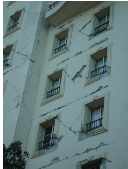
在ハイチ日本大使館 ひび割れがひどく倒壊の恐れ