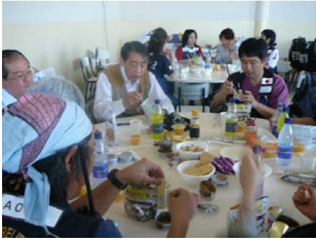
JICA 国際緊急支援隊医療チーム