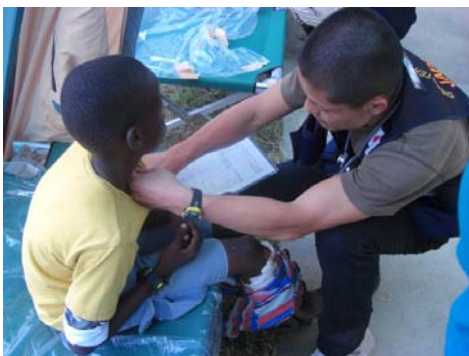
JICA 国際緊急支援隊医療チーム