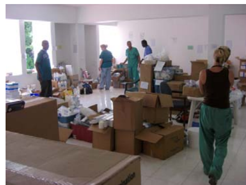
ハイチコミュニティー病院