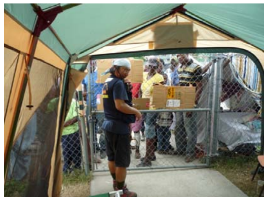
JICA 国際緊急援助隊医療チーム 診療開始をゲートで待つ患者