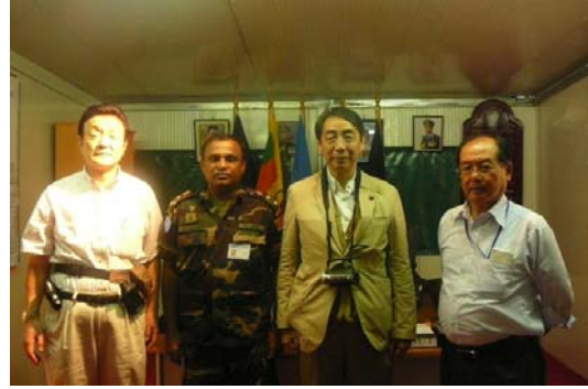
MINUSTAH（国連ハイチ安定化派遣団） スリランカ軍ベース