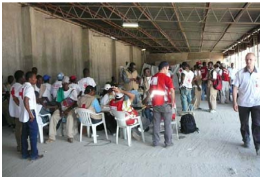
国際赤十字・赤新月社連盟サイト