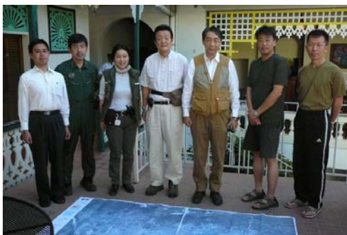
先遣隊メンバー等からのブリーフィング