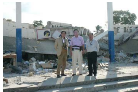
ハイチ中央郵便局前