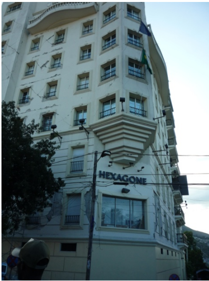
在ハイチ日本大使館