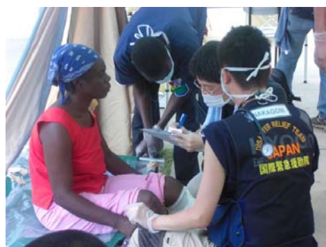
JICA 国際緊急支援隊医療チーム