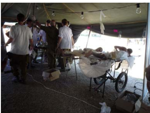
イスラエル軍医療チームサイト