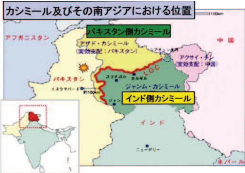
7-5 パキスタン被災地地図