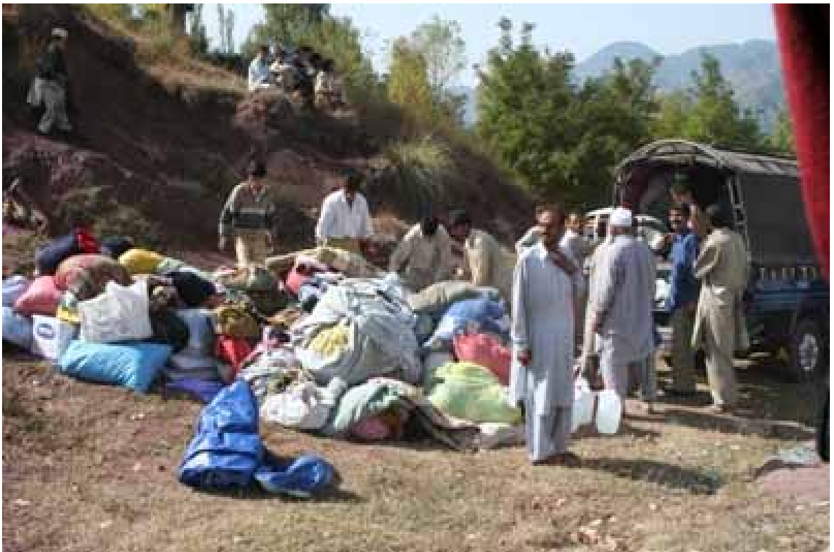
道路脇にトラックを止め援助物資を配布するところ