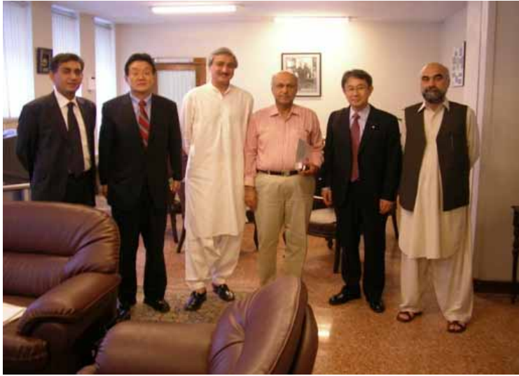
右から観光大臣、鉄道大臣、経済生産大臣

震災を受けて首相を委員長にし、関係大臣から構成する震災対策関係閣僚合同委員会を設置している。我々三大臣もその委員会メンバーである。