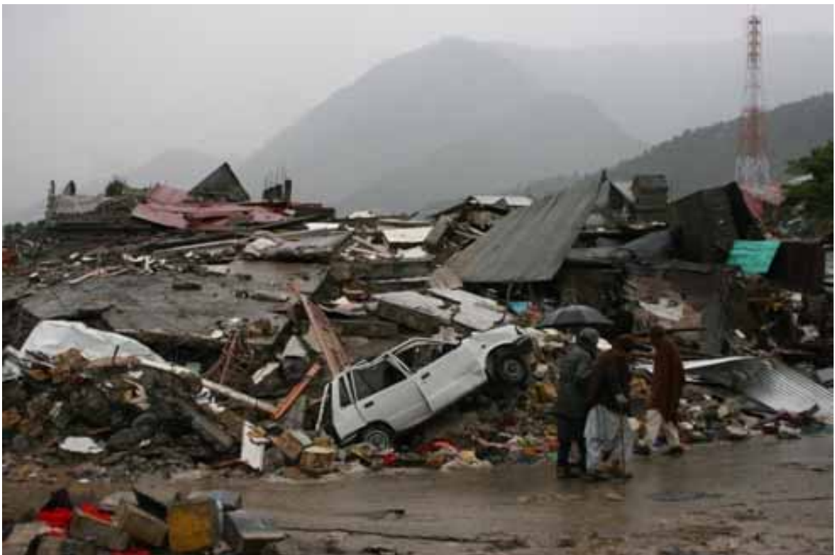
6階建てのホテルも倒壊

悲惨な状況に追い討ちをかけるように10月では珍しく雷が鳴り、激しい雨が降ってきた。被災者には避難所がないため、危険を承知で倒壊しているビルにできた隙間に身を寄せ、雨をしのいでいた。この雨で地盤が緩み、2次災害の危険性が高まってきた。こうした危険な状態にもかかわらず、大多数の生存者は瓦礫の軒先で夜を過ごすという辛酸を嘗めている。一刻も早くテントなどの避難施設を設け、被災民を安全な場所に移すことが最優先課題である。