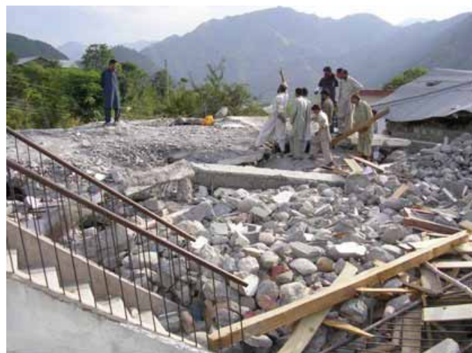
倒壊した女子中学・高校校舎