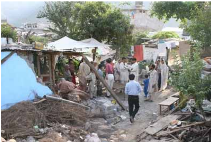
被災民からの聞き取りを行う調査団

町の通りから横に入ると、真ん中に空き地があり、それを囲む全ての家屋が倒壊している一帯に入った。老人、中年の方や小中学生や幼児が1箇所に寄り添っていたので、被害について聞いた。その中に全壊した女子中学・高校の生徒がいた。顔に傷を負い足には大きなうみが残り、うつろな表情をしていた。震災時のことについて「何も覚えていない。ここから出ていないので友人がどうしているかも分からない」と本当に悲しげに語っていた。