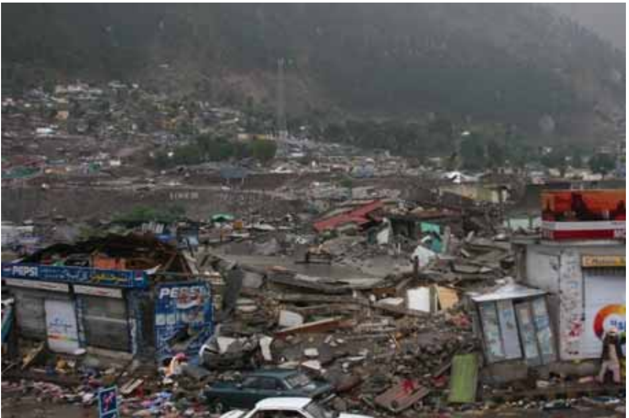
村全体が押しつぶされたように倒壊