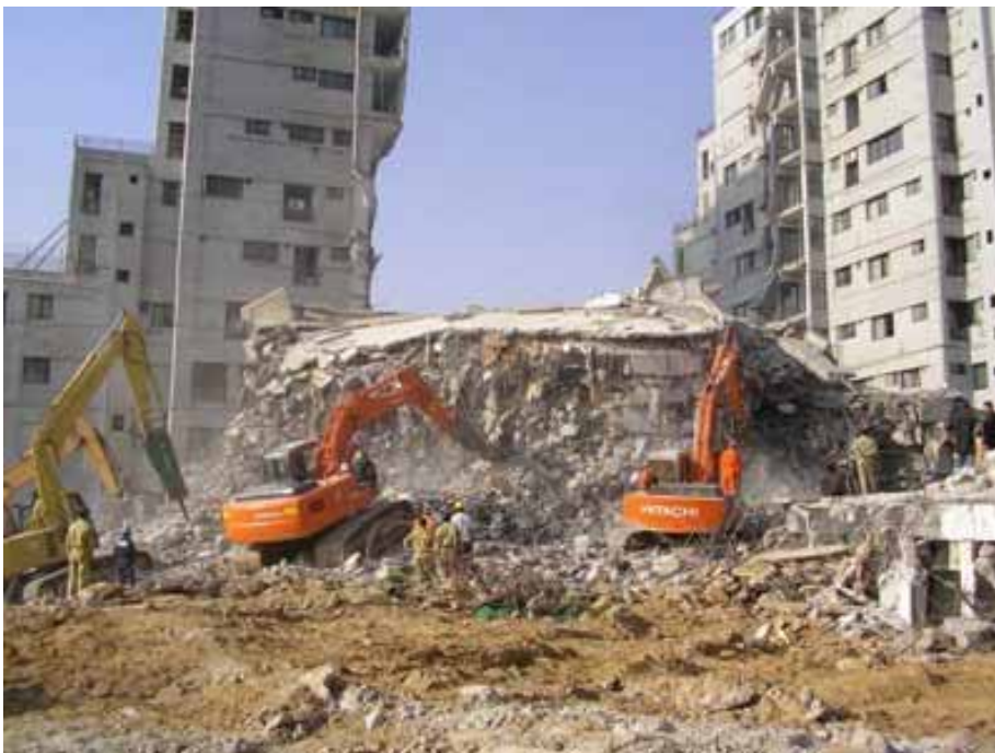
倒壊したマルガラタワー