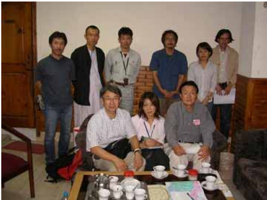
援助活動に携わる日本のNGO4団体の代表の方々と

様々なNGOの救援活動を後方支援する業務を外務省、JICA又はジャパン・プラットフォーム事務局などに担当してもらいたい。救助活動以外の業務に取り組む余裕がNGOにはないからだ。