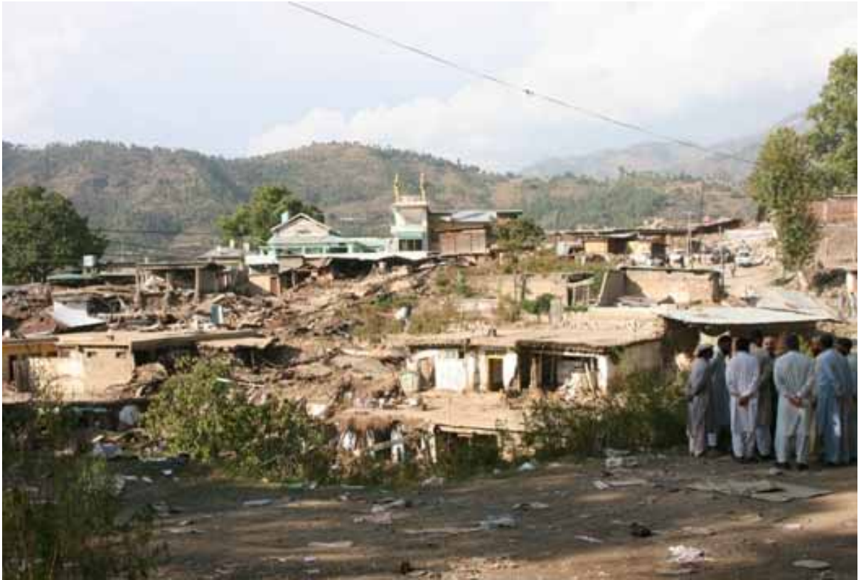
被災民から聞き取りを行う観光大臣