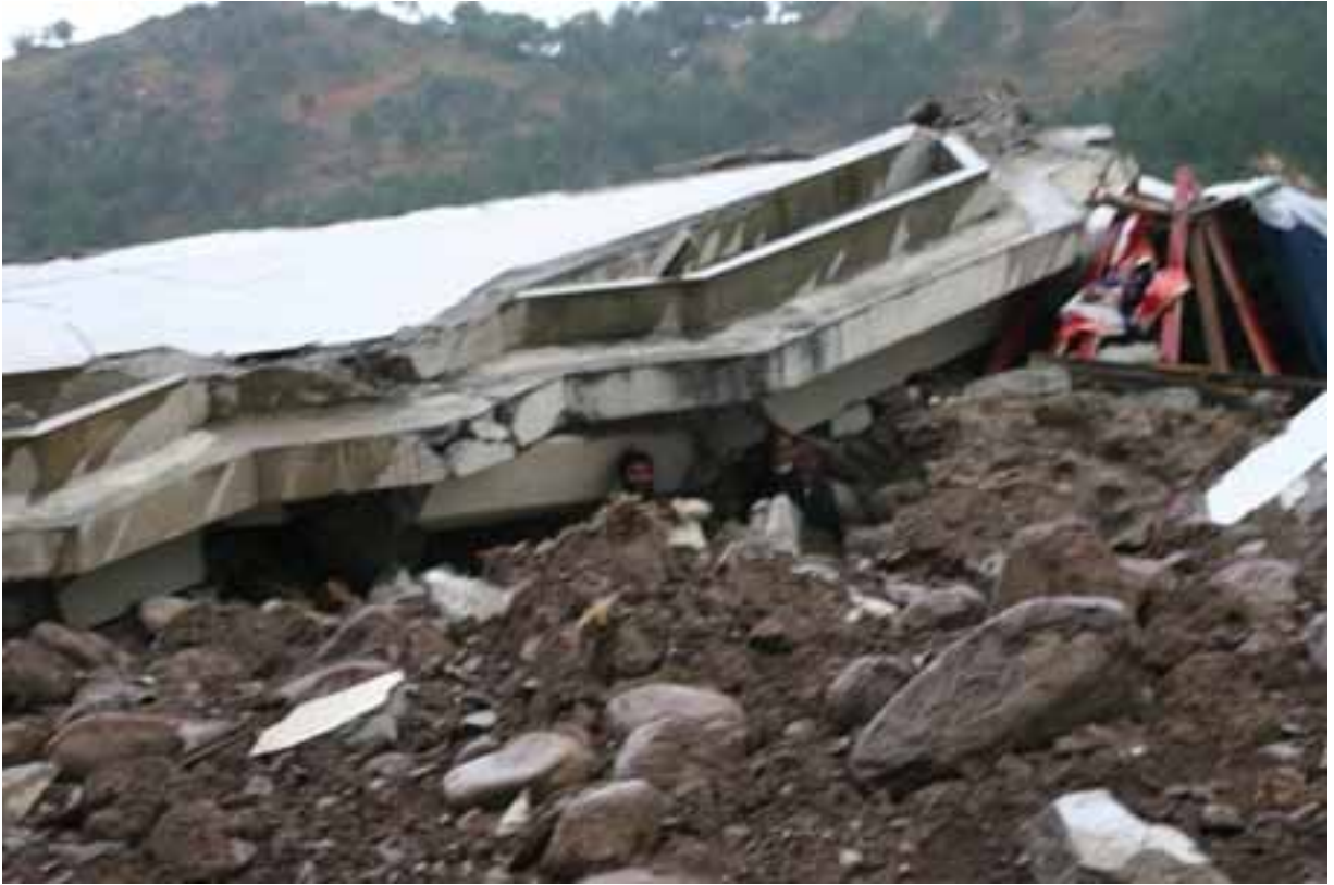
倒壊した建物で雨をしのぐ人たち