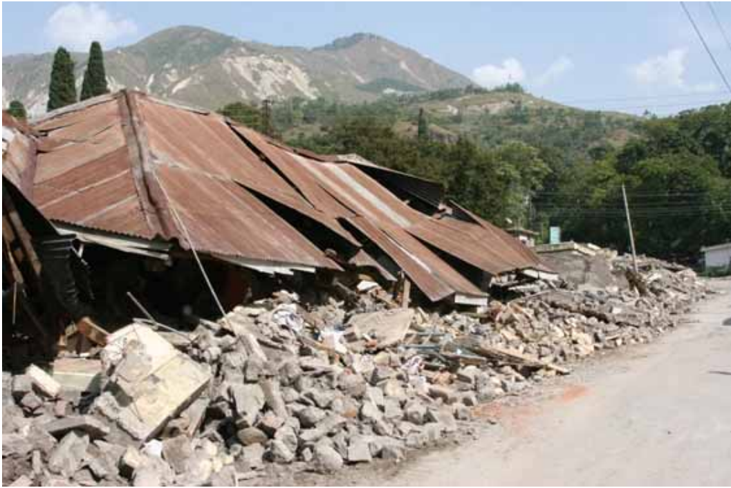
全壊した政府庁舎