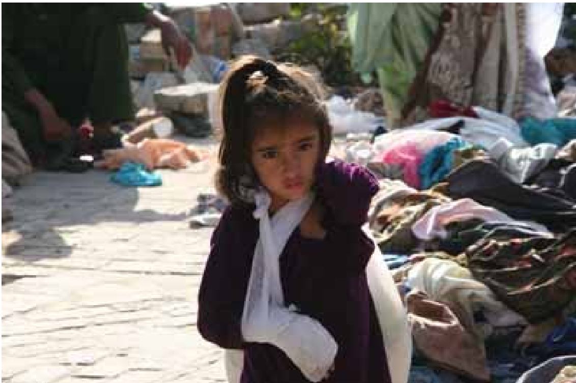
全壊した小学校痕に立つ少女

次の村に向かう途中の山間の道端でしばしば、援助物資を積んだトラックが被災者たちへ配給している光景をみかけた。こうしたトラックは全国から来たボランティアによるものや外国のNGOなど様々であった。山間の奥地まで入り、被災地域一体の状況を確認し、ハダル調査を終えた。