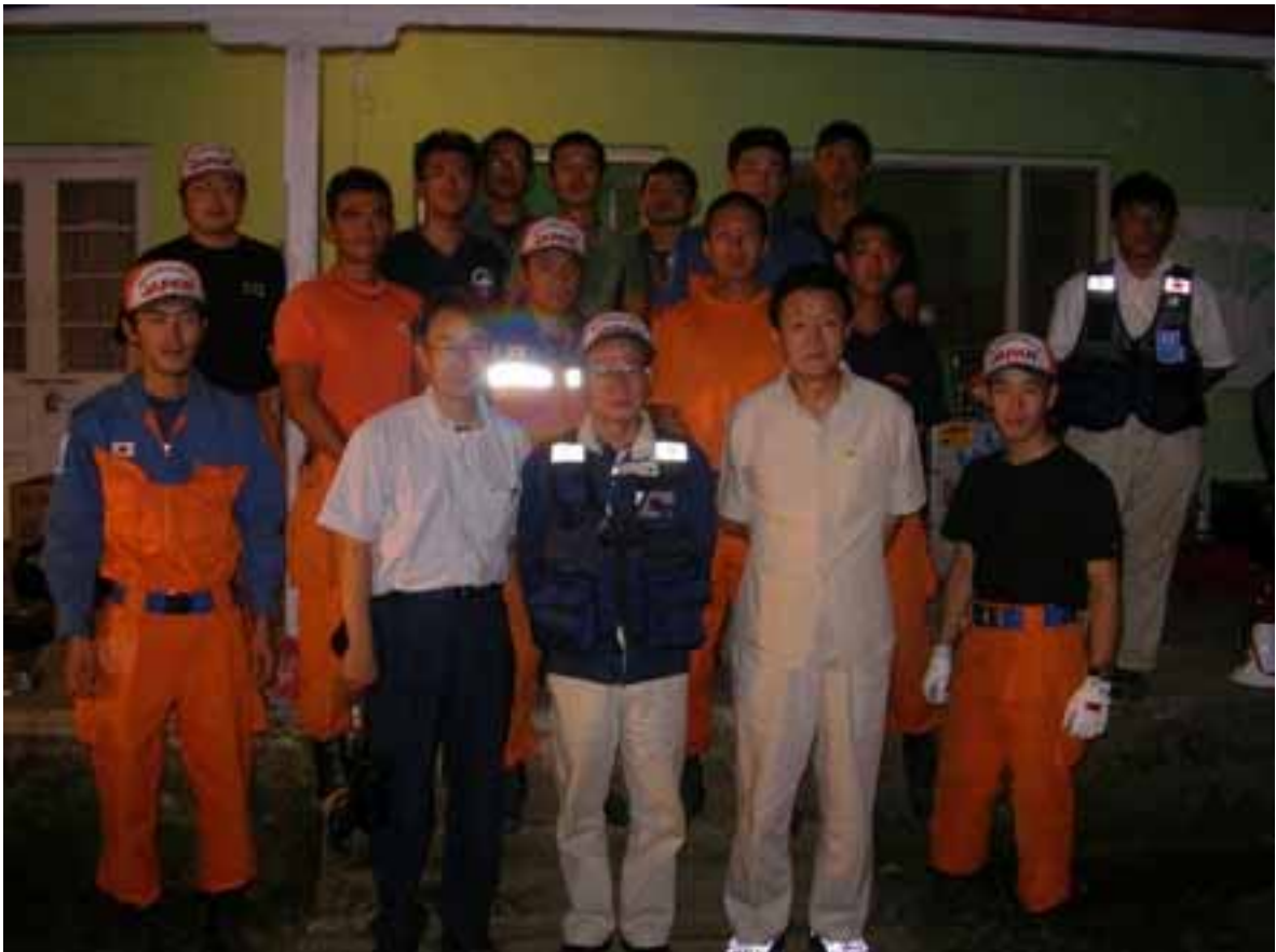
日本の国際緊急援助隊の皆さんと

最先端の捜索機器を持ち込んだが、土とコンクリートの被災現場では全く役に立たなかった。小型のショベルカーなどが必要だった。