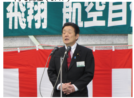
航空自衛隊百里基地記念式典 (4/17)