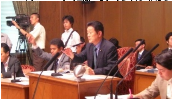
【写真:委員長席で委員会を進行】

第176回臨時国会が10月1日に開会し、先の臨時国会に引き続き参議院財政金融委員長に選出されました。開会式にご出席される天皇陛下を、衆参両院の委員長の一人として国会の正面玄関で送迎しました。