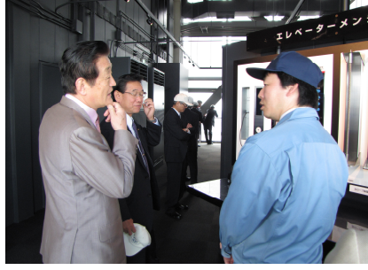
日立エレベーター研究塔視察 (5/15)