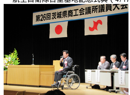
茨城県商工会議所議員大会 (8/23)