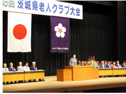
茨城県老人クラブ大会 (9/3)