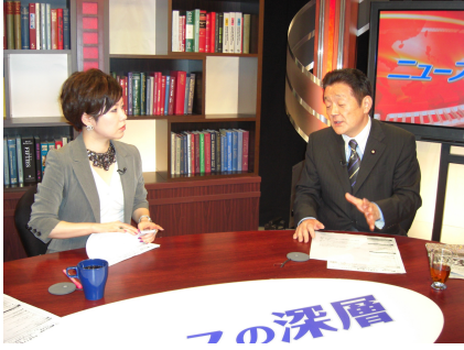
朝日ニュースターに出演 (5/17)