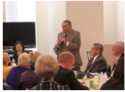
アメリカ元捕虜の講演会を国会内で開催 (9/17)