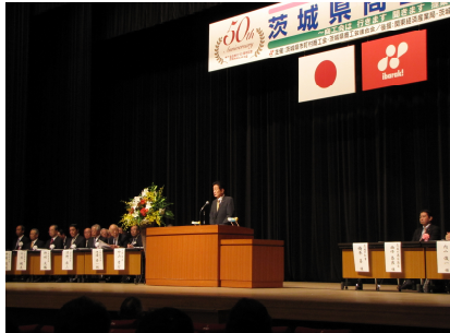
茨城県商工会大会 (9/16)