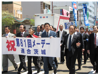
茨城県中央メーデー (5/1)