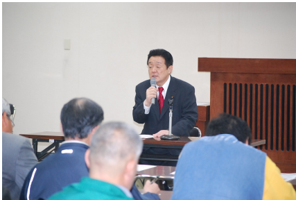
北茨城市タウンミーティング (4/26)