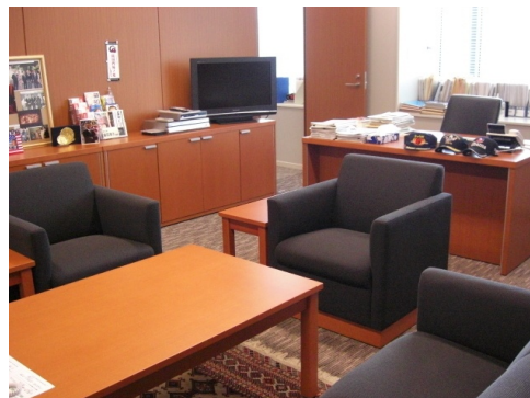
新しい参議院議員会館(議員室の様子)