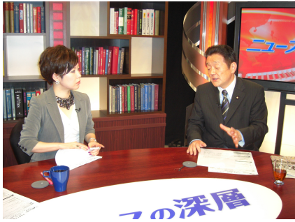
朝日ニュースターに出演 (5/17)