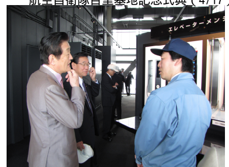
日立エレベーター研究塔視察 (5/15)