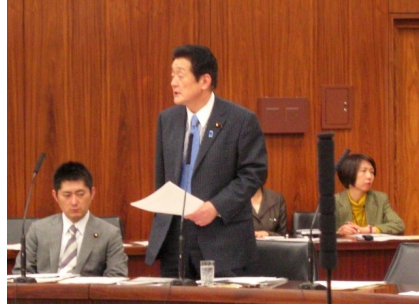
参議院決算委員会で質問 (4/12)