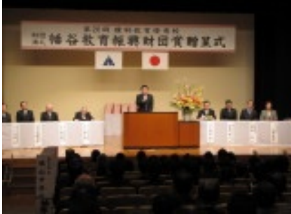
福谷教育振興財団賞贈呈式 (2/23)