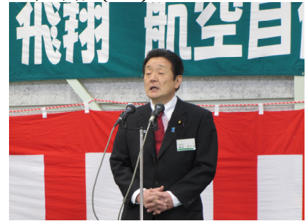
航空自衛隊百里基地記念式典 (4/17)