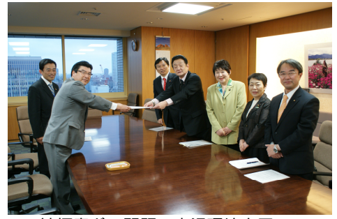
神栖毒ガス問題で小沢環境大臣へ 申し入れ (4/7)