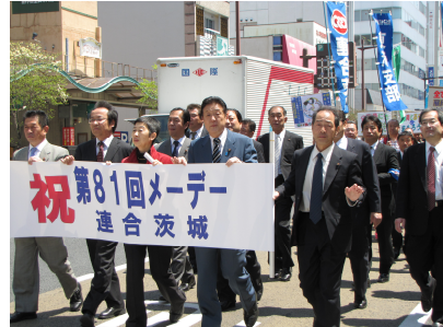
茨城県中央メーデー (5/1)