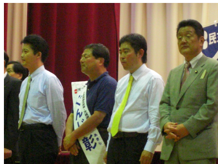
玄葉光一郎大臣が水戸へ (7/2)