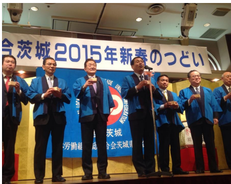
連合茨城新年会で。右から常陽銀行鬼沢会長、橋本県知事、連合茨城和田会長、郡司議員、藤田、大島議員、福島議員。