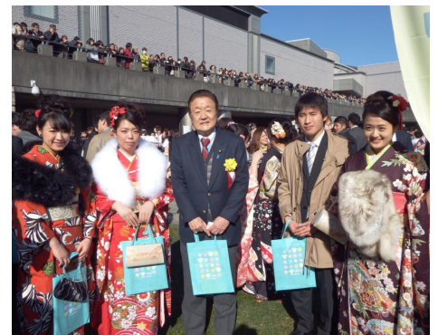
水戸市の成人式で、中学の後輩たちと交流しました。